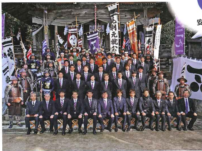
サンフレッチェ広島の本拠