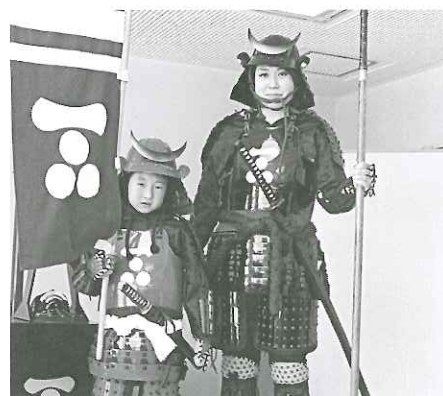
博物館、甲冑、幟旗整備