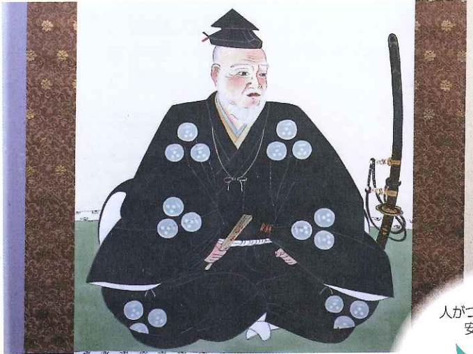
毛利元就のふるさと