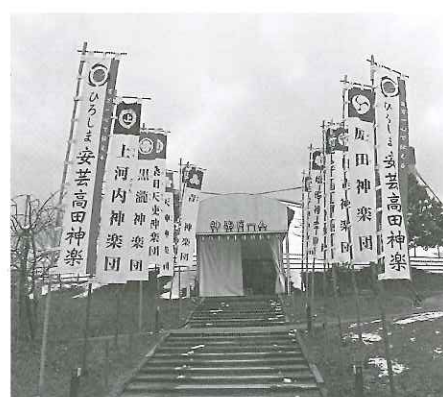
ひろしま安芸高田神楽幟旗整備