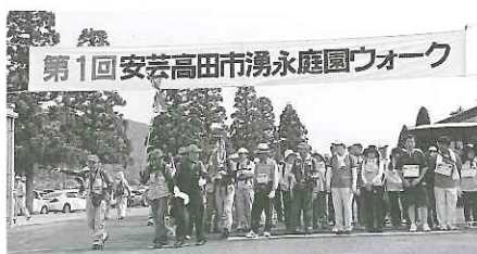
ウォーキング大会開催