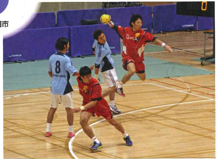
ワクナガレオリックの本拠