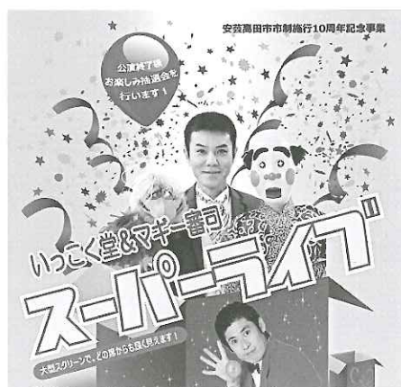
いっこく堂&マギー審司 スーパーライブ開催