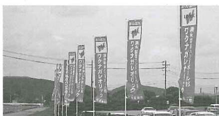
湧永レオリック・サンフレッチェ 広島応援幟旗整備