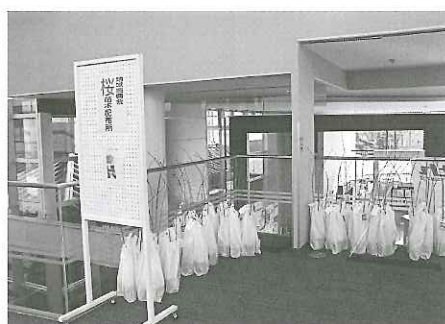
各振興会に桜苗木配布