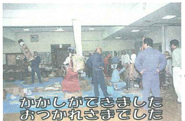
かかしができました おつかれさまでした

歌詞の記憶と音程を覚えることにより 脳を活性化させ、又複式呼吸により健康 が保てます