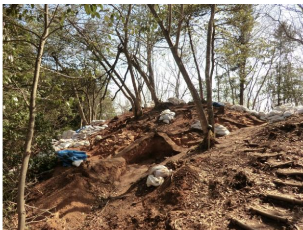
甲立第2号古墳墳丘