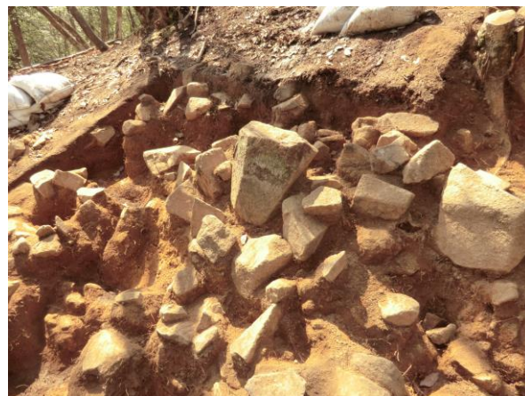
墳丘葺石検出状況