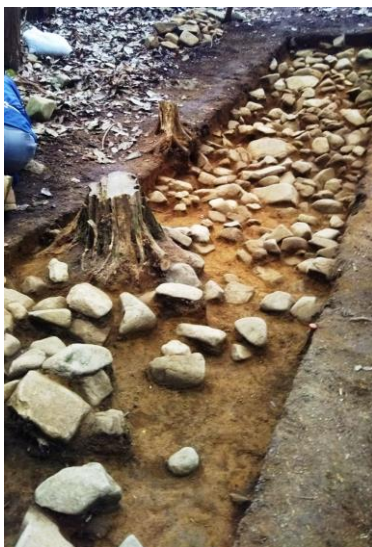
後円部斜面 葺石の出土状況