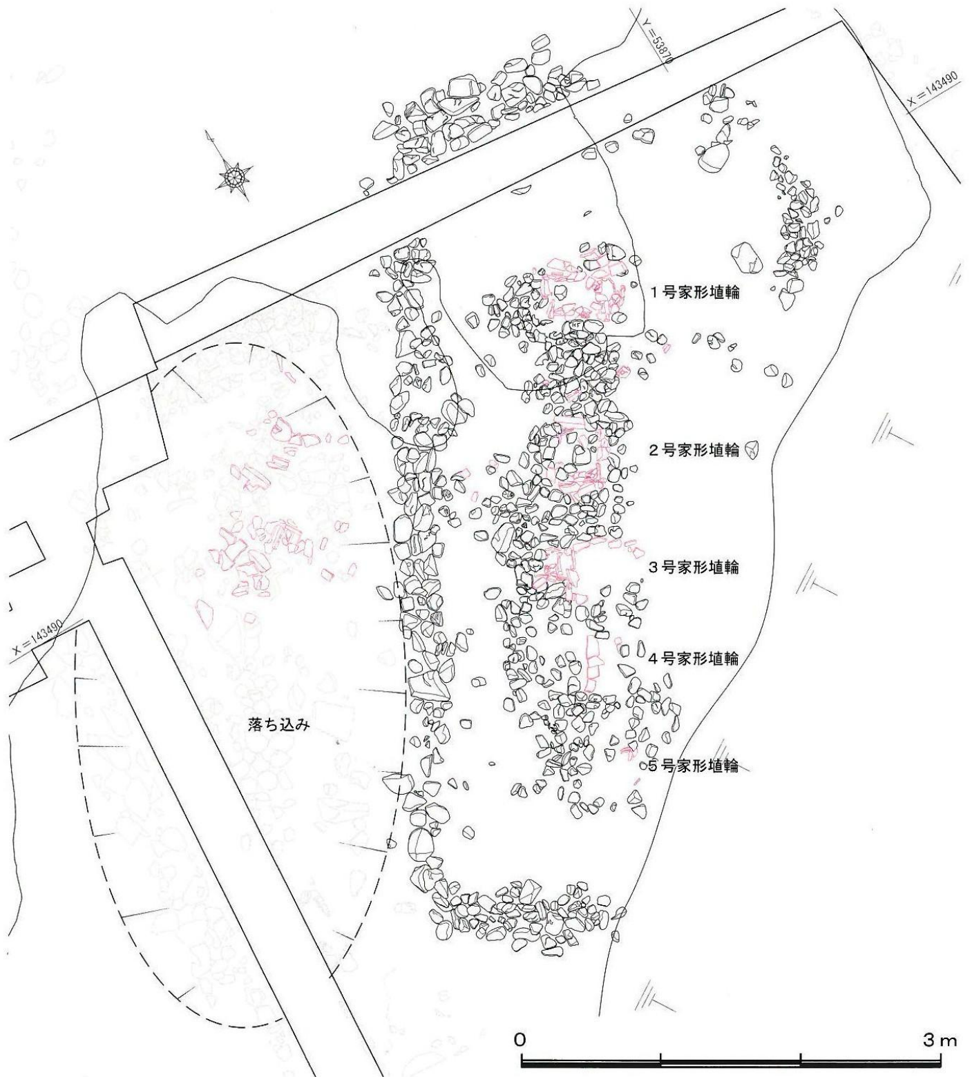
石敷区画・家形埴輪配列実測図