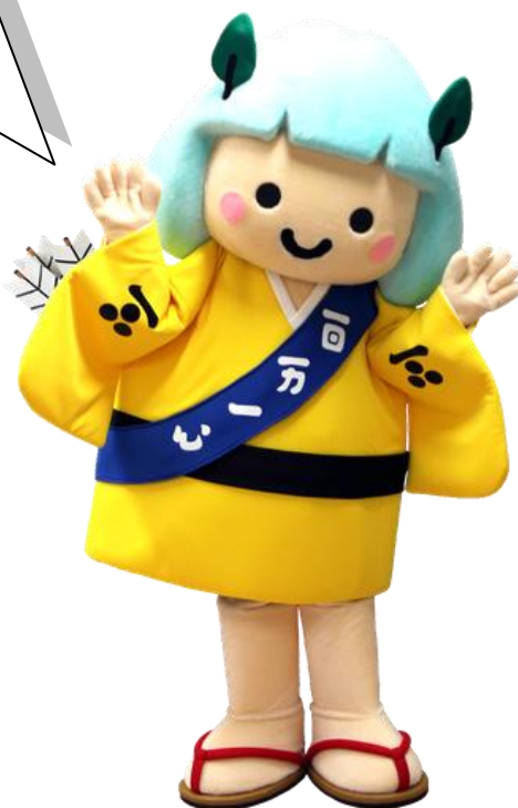
安芸高田市マスコットキャラクター「たかたん」