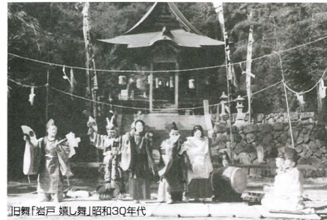
旧舞「岩戸 嬉し舞」昭和30年代