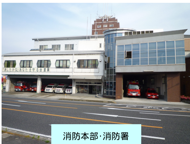
消防本部・消防署