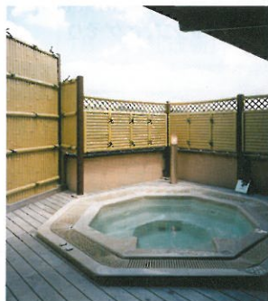
泡が心地よい屋外ジェットバス