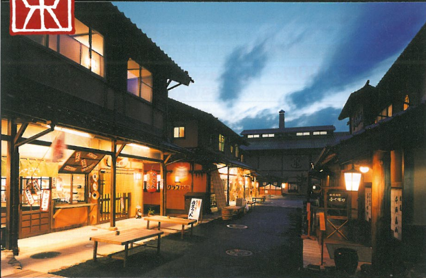
どこか懐かしい街並