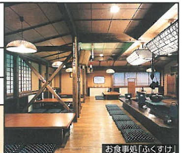
お食事処「ふくすけ」