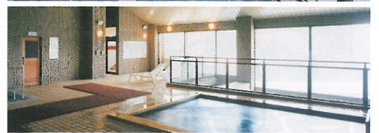
2階にはサウナや寝湯も