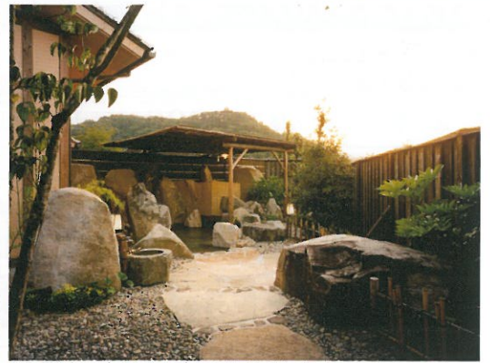
外の空気が気持ちの良い露天風呂。打たせ湯もあります。