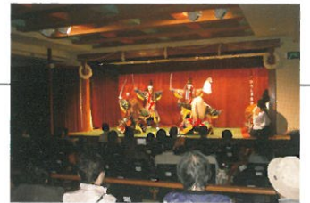
〈かむくら座〉150人収容の小劇場

神楽門前湯治村のかむくら座で行われる週末の夜の公演です。公演終了後は、上演演目の解説や衣裳試着体験、記念撮影など団員と観客とのふれあいの時間を設けています。 ●金曜日 夜神楽 —— 夏期(4月～11月) ●土曜日 夜神楽 —— 1年中(12ヵ月)