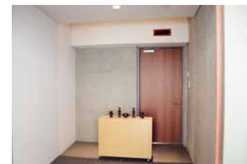
動物お別れ室 (小動物専用お別れ室)