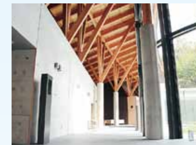
建物全体に漂う木のぬくもり

最新鋭の火葬炉設備により、これまでの火葬場のイメージを払拭する、無煙・無臭等の無公害施設としています。また、すべての人にやさしいユニバーサルデザインの理念に基づいた地域に受け入れられる施設整備をめざしました。