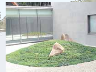
建物中心に配置された静寂の庭