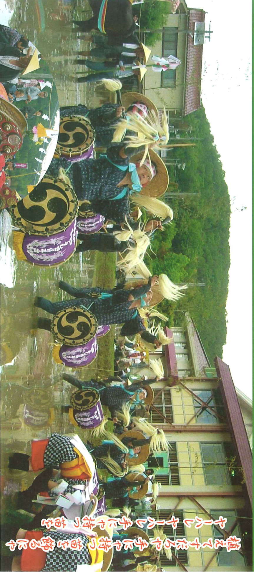
植えて手振るや手に平持の苗を飾るにや 平に平に手に平持の苗を