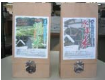
3・5・10kg の販売用米袋

販売用の専用米袋を購入しましたので、ぜひ水車米を贈答品などにご利用いただきたいと思います。