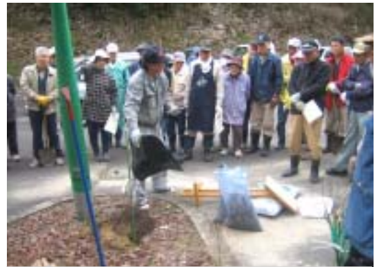
専門家から植栽方法の指導を受ける