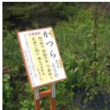
31 種類の看板を設置

当日は参加者が 60 人余りあり、植栽方法を専門家から聞いた後、各行政区に分かれて植物の植栽を行ない、それぞれの行政区の名前が入った和歌の看板を立てました。