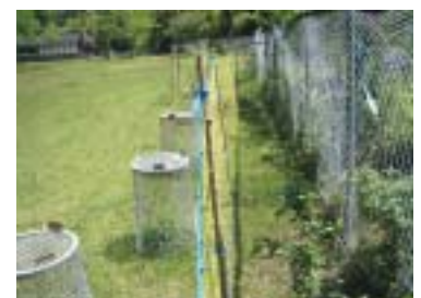
周辺にサクラの苗を植栽