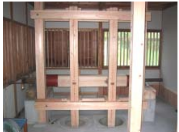
改修により石臼を 2 個設置しました

水車米と本郷の棚田米(「棚田」と「水車」のこだわり米)の販売用の専用袋 2 種類を印刷しました。