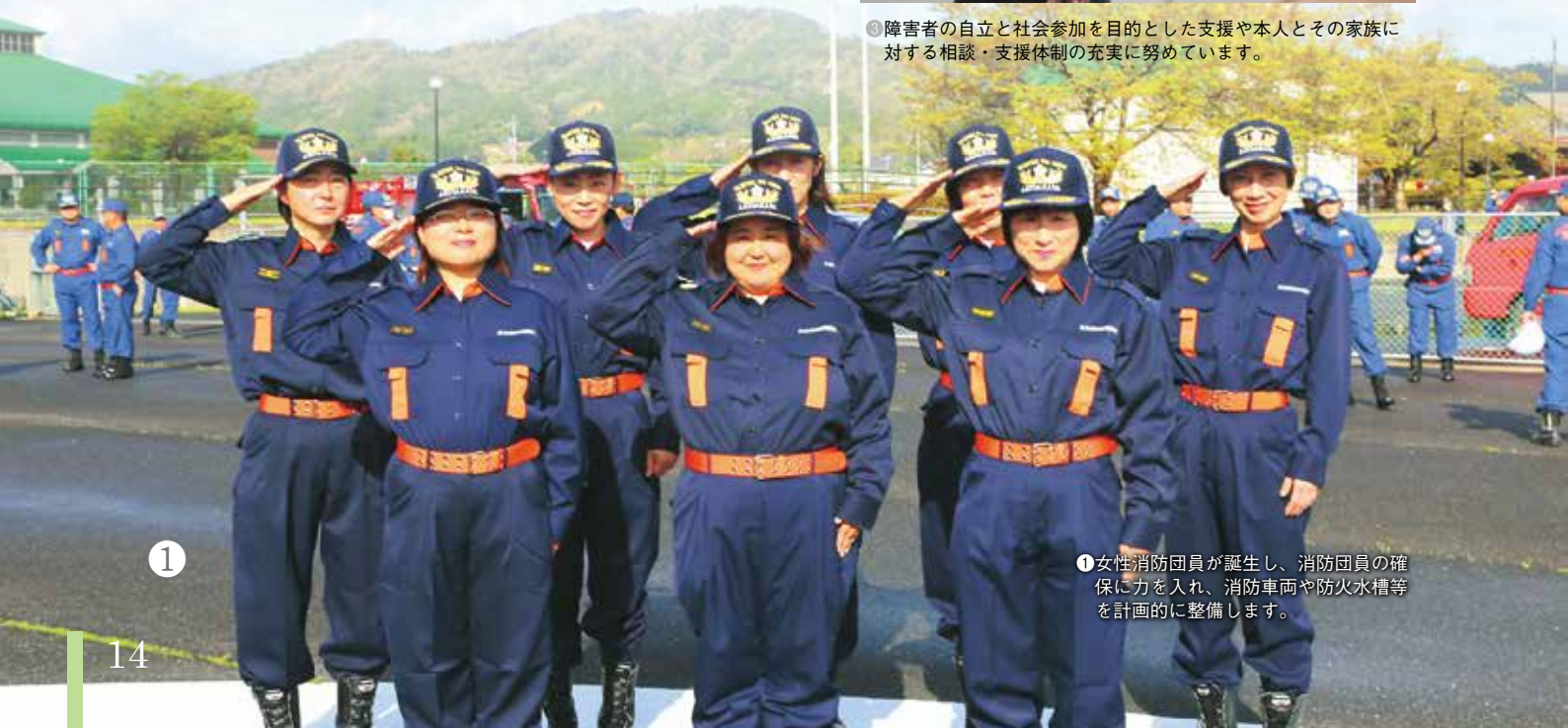
③障害者の自立と社会参加を目的とした支援や本人とその家族に対する相談・支援体制の充実に努めています。