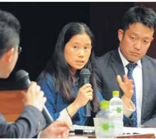
安芸高田市民フォーラムの様子

窓口業務の利便性向上、市民要望への迅速な対応等、サービス向上に努めます。 市民や業者から信頼される入札執行に向け、入札・制度の改正を適宜行うほか、入札・検査は工事担当でない部に配置する等、公平・透明性の向上を図ります。 芸北広域環境施設組合における事務・事業の共同処理を推進するとともに、消防・救急における隣接自治体との連携を強化します。 また、広島広域都市圏協議会やまち起こし協議会（神楽・食と酒）を通じて、広域連携・交流ネットワークの形成を推進します。 市総合計画の円滑な推進を図り、関係事業の早期実施を促進していくため、国・広島県との連携強化と緊密な協議・調整に努めます。