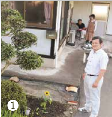
① 子育て・婚活住宅取得補助金などによる若者世帯の移住・定住を推進しています。

自然と都市機能がバランスよく調和した、誰もが安全で快適に暮らせる魅力ある田園都市を形成し、定住の促進を図ります。