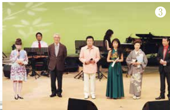
③「ふるさと応援の会」の力を借り、市外からの視点を活かし、安芸高田の魅力づくりにつなげていきます。

主要産業である農業や製造業をはじめ、林業や水産業の活性化、インターネット環境の充実による新たな産業創出、柔軟な発想を活かした起業支援など、多様な働く場、働き方の創出を図ります。