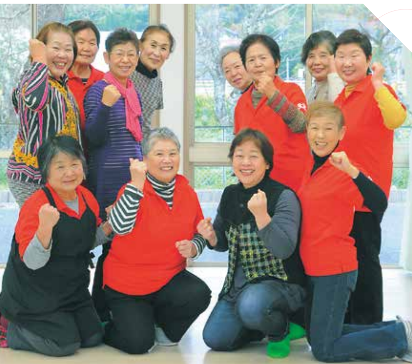
②「市民総ヘルパー構想」に基づく、地域包括ケア構築に係る地域機能の整備を行っています。