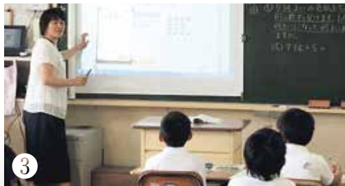
③ 学習補助員・非常勤講師を配置し、児童・生徒の確かな学力向上をめざします。また、ICTを活用した分かりやすい授業づくりに努めています。

誰もが安心して子どもを産み、育てることができるよう、子育て支援と就学前教育の充実を図ります。