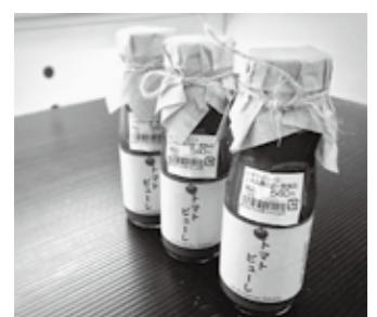
100%安芸高田市産なつのしゅん トマトピューレです。

りつつ、自分のできる事をコツコツやっていこうと考えています。 協力隊に就任してから、春のアートまつり in 向原に始まり、夏の安芸高田花火大会、JAまつり、いのしかんフェスティバル、ツールド安芸高田(安芸高田市内を自転車で行く競技大会) などその他様々なイベントに主に裏方として関わらせて頂きました。その中でも、一心祭りでは鎧を着る機会があり、なかなかできない体験をさせて頂きおもしろかったです。 そんなこんなで、また一年、協力隊員として地域営農課のお仕事に関わらせて頂きつつ、未知の世界にも挑戦していけたらなと思います。どうぞよろしくお願ひします。