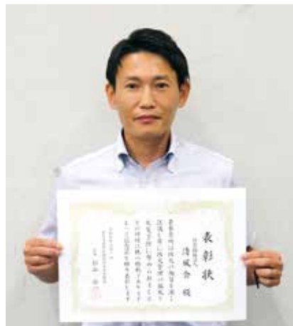
優良防火管理事業所表彰 社会福祉法人 清風会 様