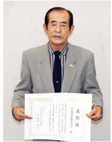
優良危険物取扱事業所表彰 日南商事株式会社 様