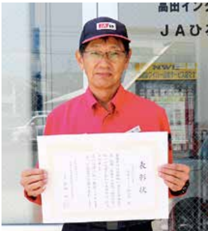
優良危険物取扱事業所表彰 JAひろしま 高田インター給油所 様