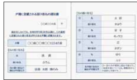
送付した通知はがき(見本)