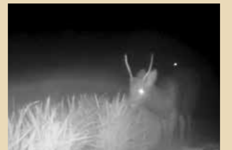
二番穂を食べるシカ

稲刈り後の株から再生して伸びてくる「 にばんぼ 二番穂」は、野生鳥獣にとっては稲と同じくとてもおいしくて栄養価も高く、魅力的なものです。この二番穂に鳥獣が餌付いてその魅力を覚えてしまうと、翌年付近の田んぼが鳥獣被害に遭う可能性が高くなってしまいます。秋から冬の田んぼは二番穂対策が大切。しっかり管理して翌年の被害を防ぎましょう。