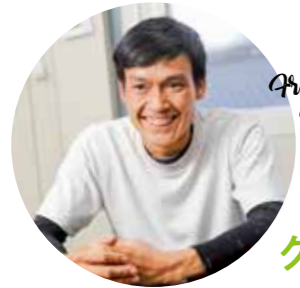
From Vietnam ベトナム