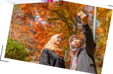
休日は友達と近所を散歩。郡山公園に写真を撮りに行くことも。