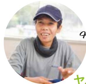
From Indonesia インドネシア