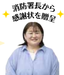
消防署長から感謝状を贈呈

ただ机に伏せているだけではなく、手が下にだらんと落ちていて、何かおかしいと思いました。「大丈夫かな?」と思ったら、まずは声を掛けることが大事。何をすればよいのか迷い戸惑いましたが、特別な知識がなくてもできることはあります。119番通報をすれば、電話で適切な処置を教えてください。地域には高齢の方も多く、少し気に掛けるだけでも、救える命があるのかもしれない。