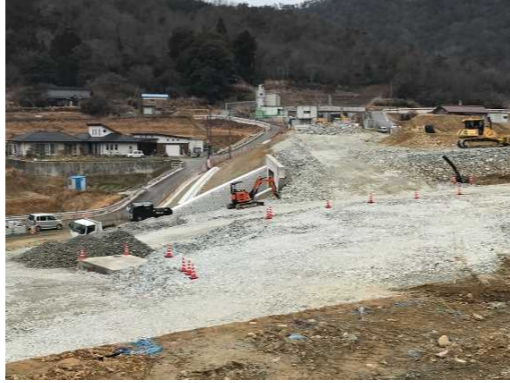
ヤード全景（工事起点付近）