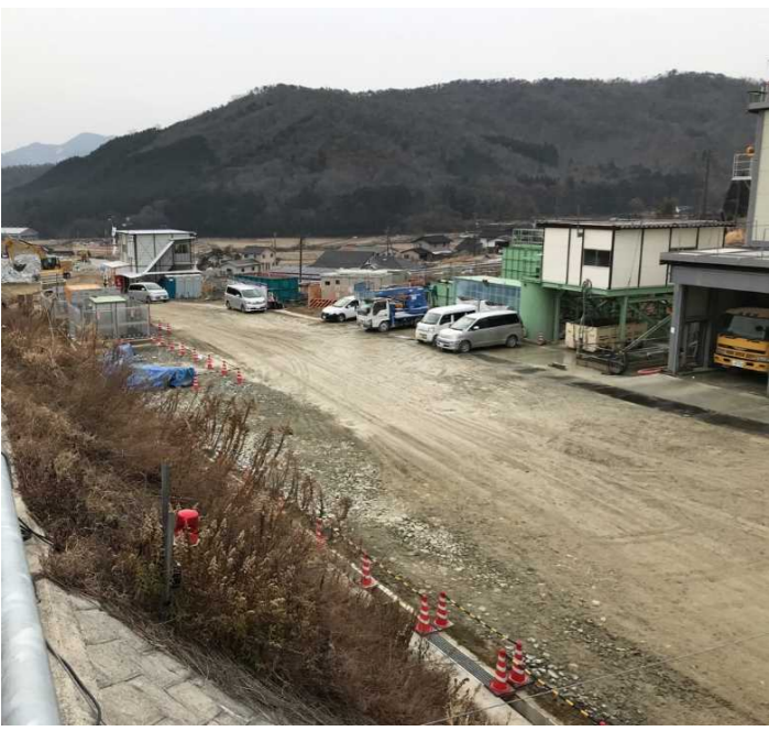
仮設ヤード付近作業状況