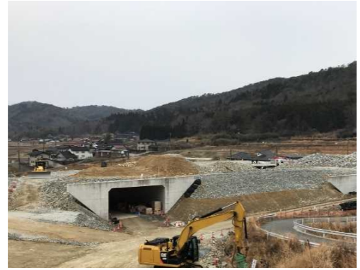
ヤード全景（工事起点右側より）