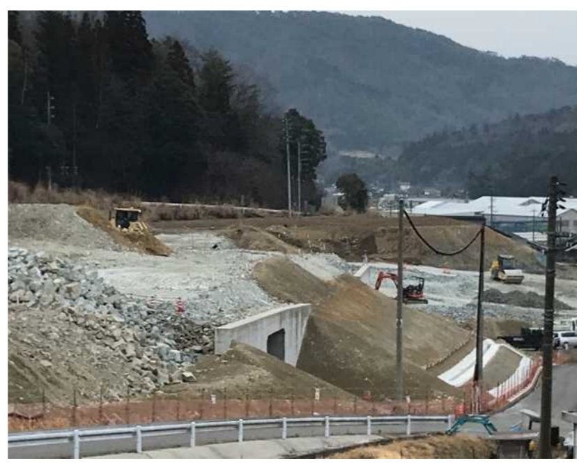
路体盛土作業状況