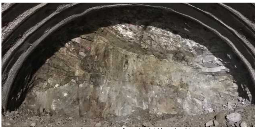
切羽（トンネル内の掘削箇所）状況