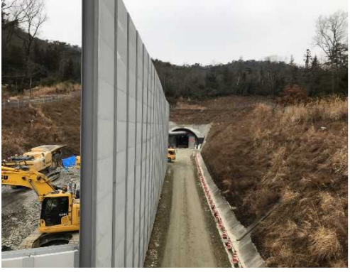
ヤード全景（トンネル坑口部）