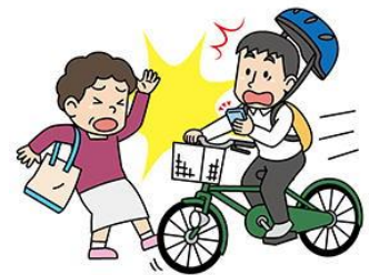
☆ながら運転の禁止