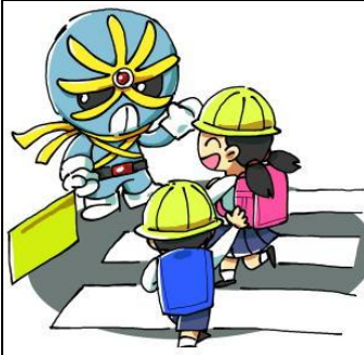
☆横断歩道は歩行者優先

なお、認定教育・検査を実施している自動車学校等では、手数料が異なる場合がありますので、各自動車学校等へお問い合わせください。