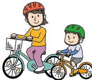
☆自転車ヘルメットの着用