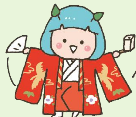
公式マスコットキャラクター 「たかたん」