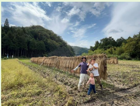
先輩協力隊員が全力でサポートします！