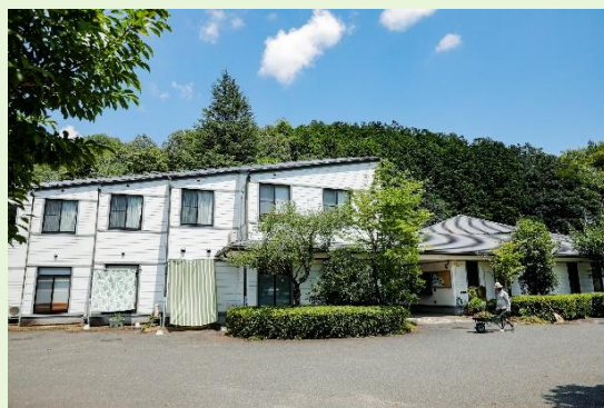
エコミュージアム川根