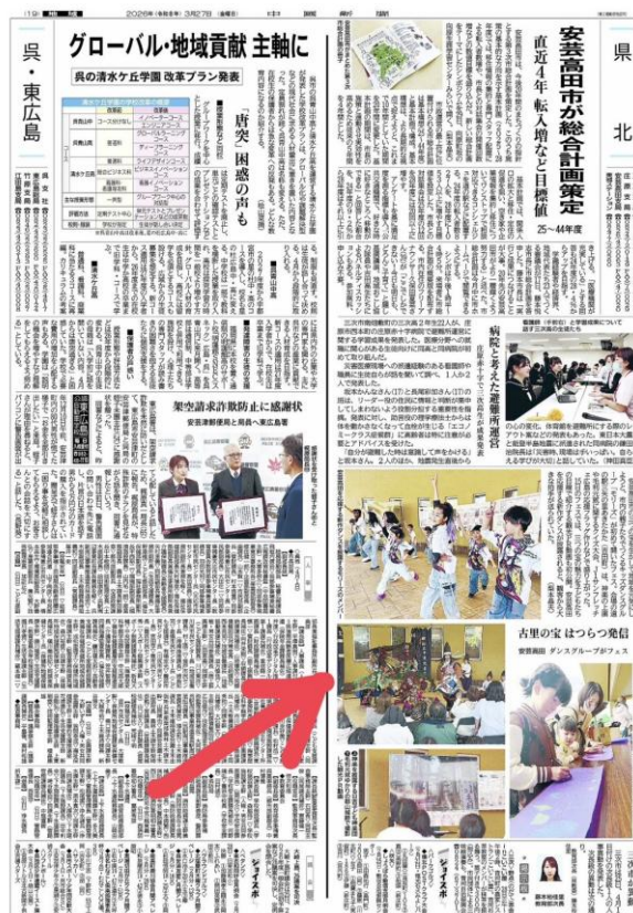
中国新聞 3 月 27 日朝刊フェス実施記事