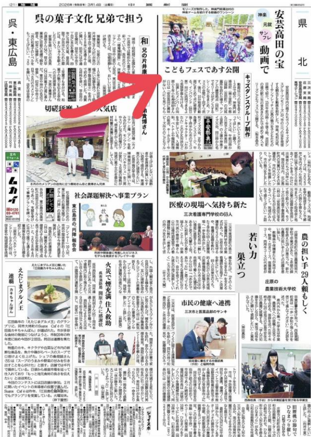
中国新聞 3 月 14 日朝刊での告知記事