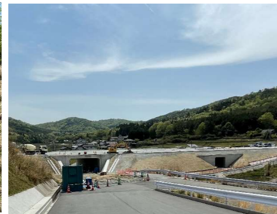
ヤード全景（工事起点右側より）