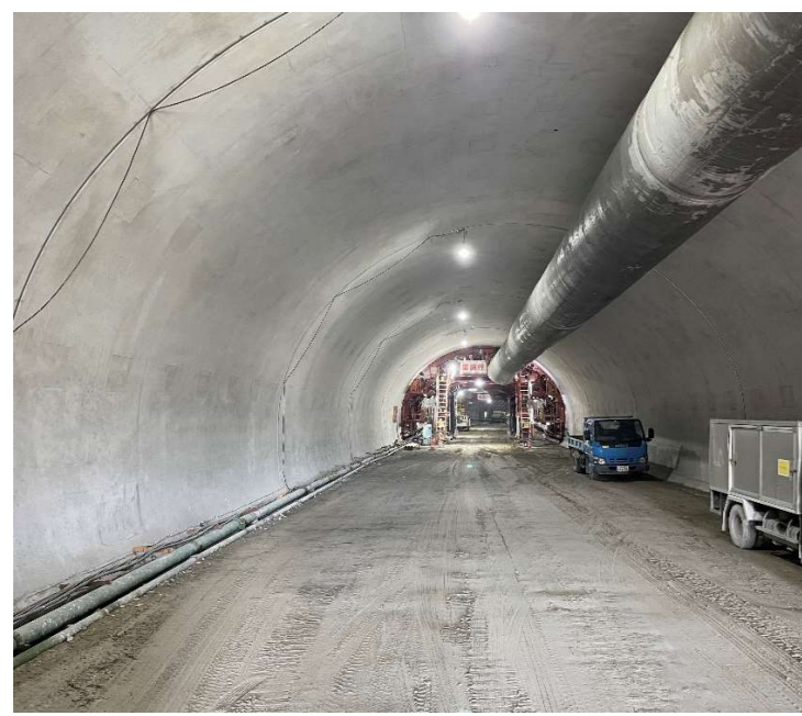
トンネル坑内状況（覆工コンクリート）