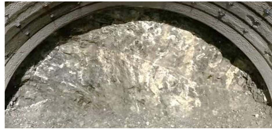
切羽（トンネル内の掘削箇所）状況