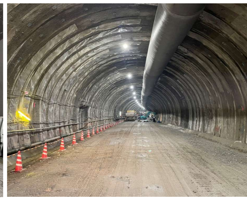
トンネル坑内状況（中間付近）