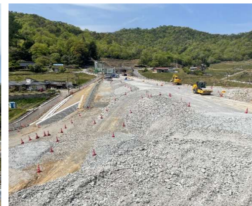
ヤード全景（工事起点付近）