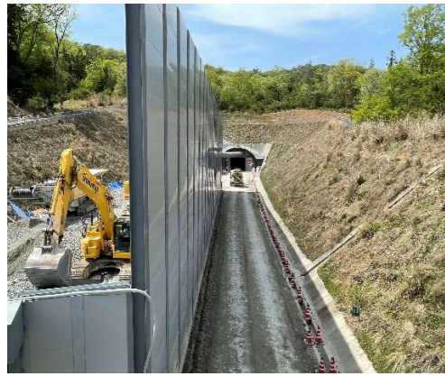
ヤード全景（トンネル坑口部）