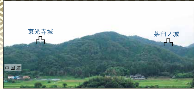
東光寺城・茶臼ノ城遠望(北側より撮影)

【登城ガイド】①東光寺城②茶臼ノ城 標高/①420m ②460m 比高/①120m ②160m 史跡指定/未指定 城主/不明 所要時間/ともに中国道脇から20分