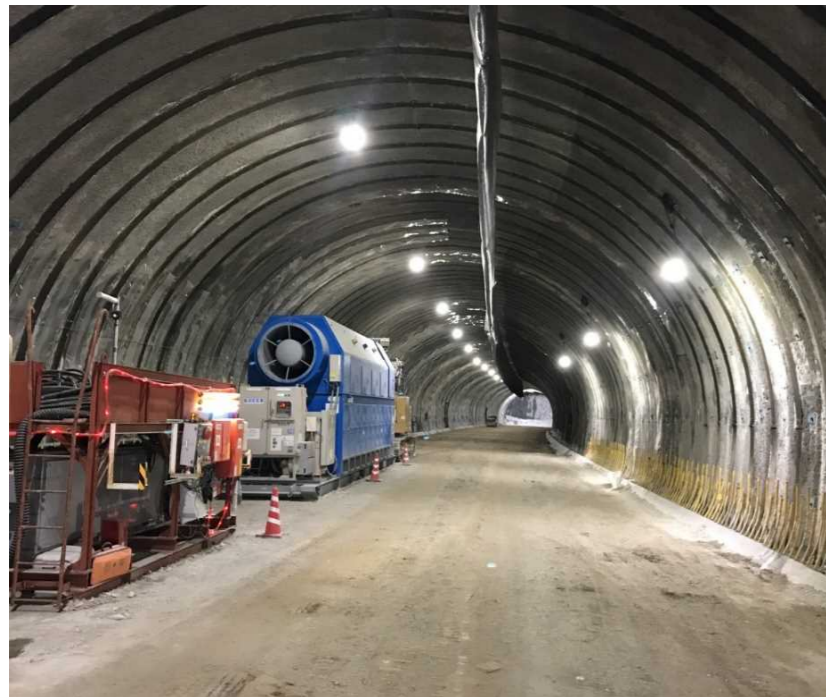
トンネル坑内状況