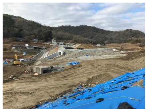
ヤード全景（工事起点付近）