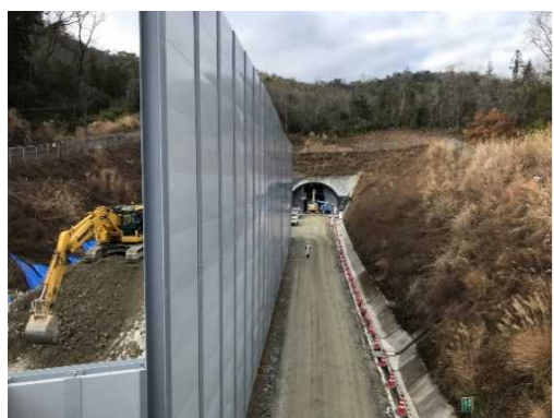
ヤード全景（トンネル坑口部）