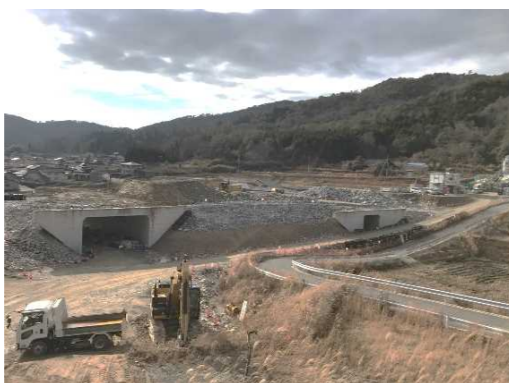
ヤード全景（工事起点右側より）