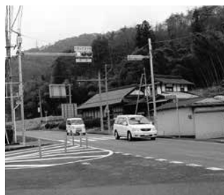
信号機が設置された丹比郵便局前の交差点。