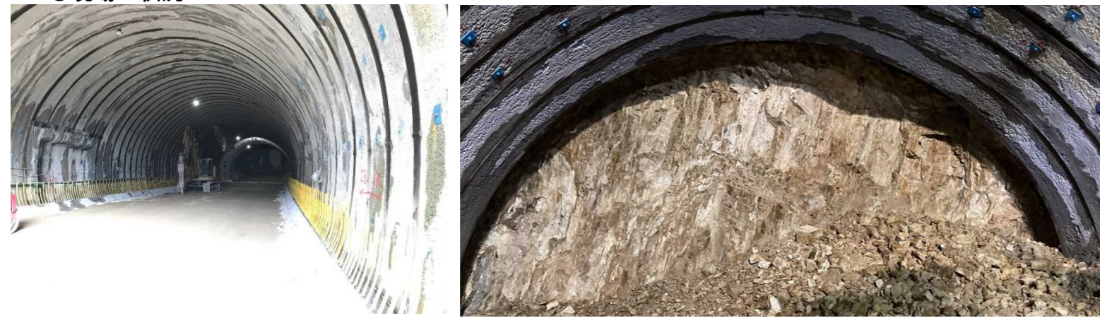
トンネル坑内状況