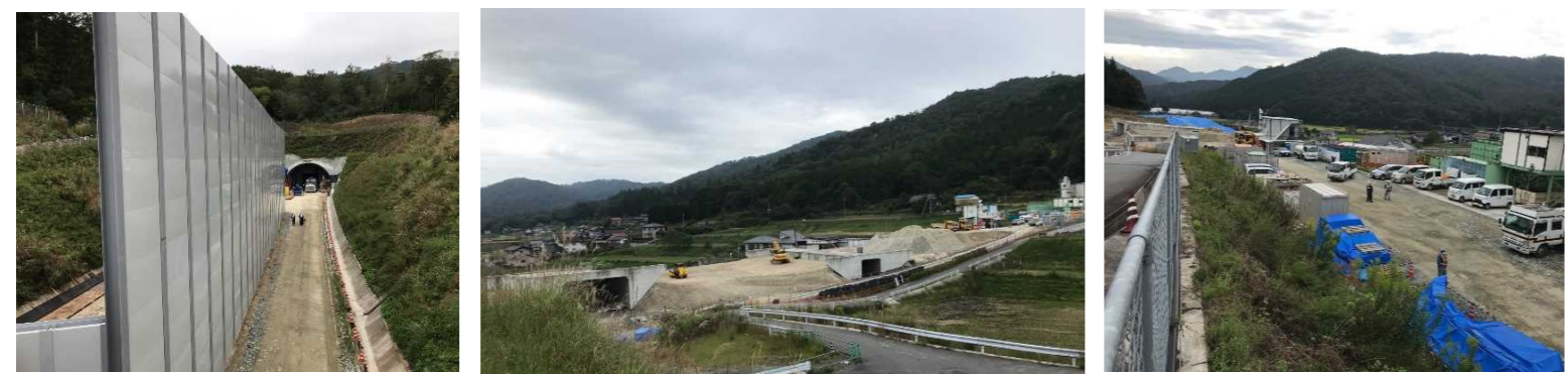
ヤード全景（トンネル坑口部）