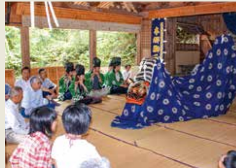
2000年代初頭の演舞の様子

悪魔払いや麦の虫害防止を願う「虫送り」の神事として、神幸神社で奉納される本郷獅子舞。激しく顎を打ち鳴らす独特の舞が特徴で、過去に四国などで披露されたこともあります。動きや型は練習を重ねて体に刻み、受け継いできた伝統技術。習ったままを変えず、絶やさず残したいという思いが、今も舞に息づいています。