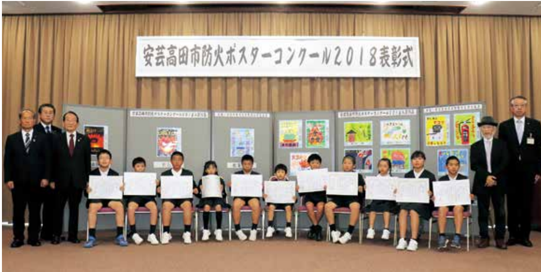
安芸高田市防火ポスターコンクール2018表彰式