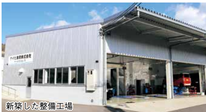
新築した整備工場