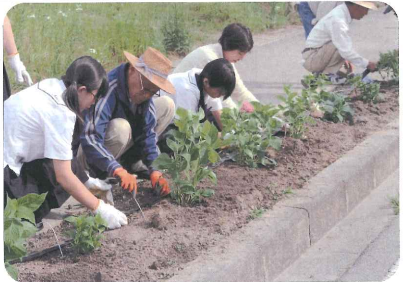
あじさい植栽の様子

最後になりますが、会員皆様には、坂下地域振興会の諸事業運営に今後ともご支援ご協力をお願い申し上げます。