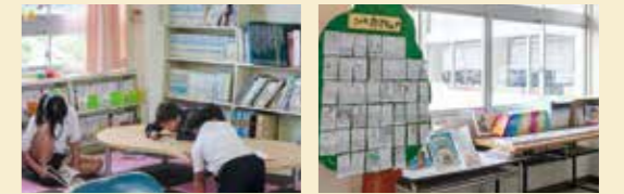
マットやローテーブルでくつろげる図書室に。図書委員が映画上映の企画も行います。 校内のいたるところに飾られているPOP。