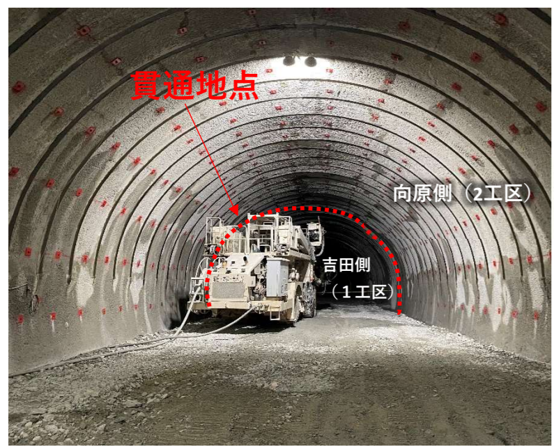
トンネル貫通地点（向原側より）