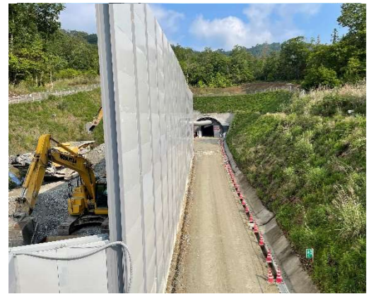
ヤード全景（トンネル坑口部）