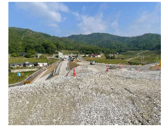
ヤード全景（工事起点付近）