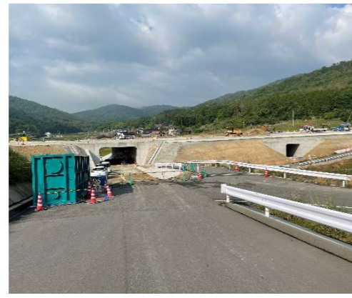
ヤード全景（工事起点右側より）