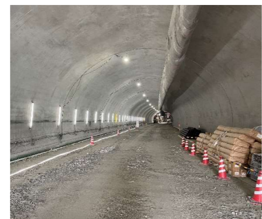
坑内状況（覆工コンクリート）