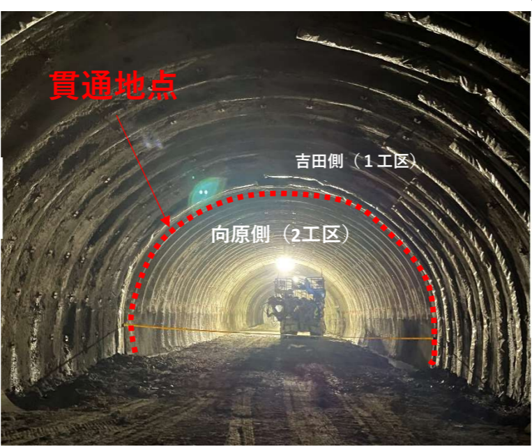
トンネル貫通地点（吉田側より）