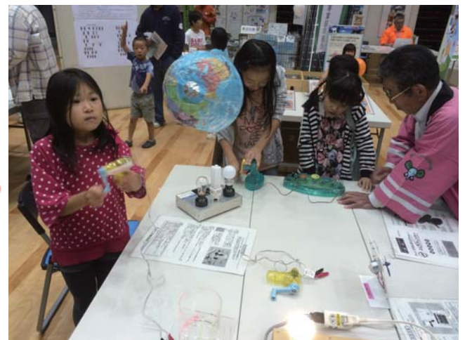
浮き浮き実験器(左)とエリチェンジャー(右)

エコ体験コーナー 省エネ実験 コーナーでは 発電のしくみ や電気が他の エネルギーに変換され ることが学べる小道具 を使い、来場者に電気 の大切さを体験して もらいました。また、電 気を使わない昔の遊び も楽しんでもらいま した。