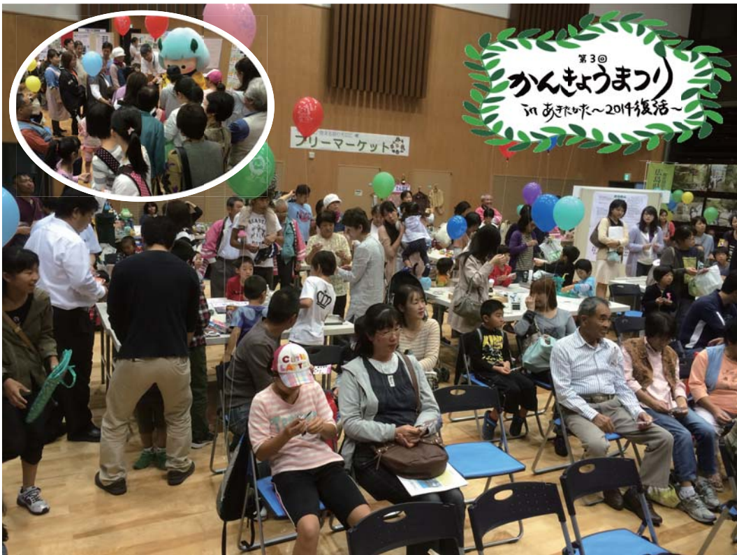
来場者でにぎわう会場

平成26年10月5日、向原生涯学習センターみらいにて、安芸高田市主催による環境保全啓発イベント「かんきょうまつり in あきたかた～2014復活～」が開催されました。環境もやい☆安芸高田はエコ体験コーナーに出展し、小型風力発電の体験や昔の遊び教室、ふろしきの包み方講座を行ったほか、環境ブースにおいて「ちいさい秋みつけた!」ドングリがなる木の展示を行いました。また環境もやい☆安芸高田としてもパネルを展示し、これまでの活動を紹介、新聞の配布を行いました。