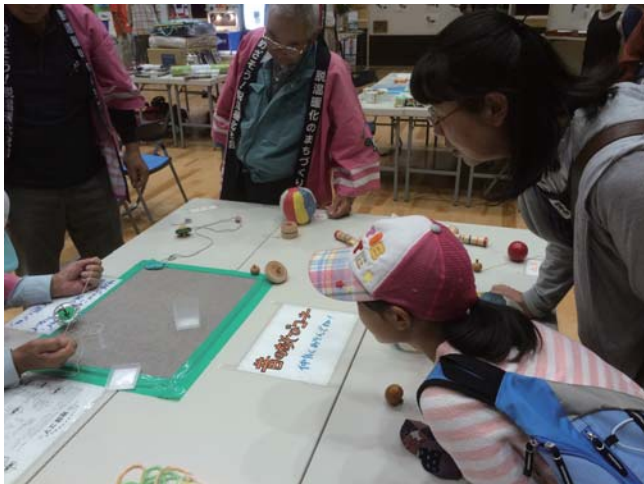
地球ゴマやけん玉などの昔の遊び