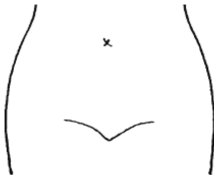
(ストマ及びびらんの部位等を図示)