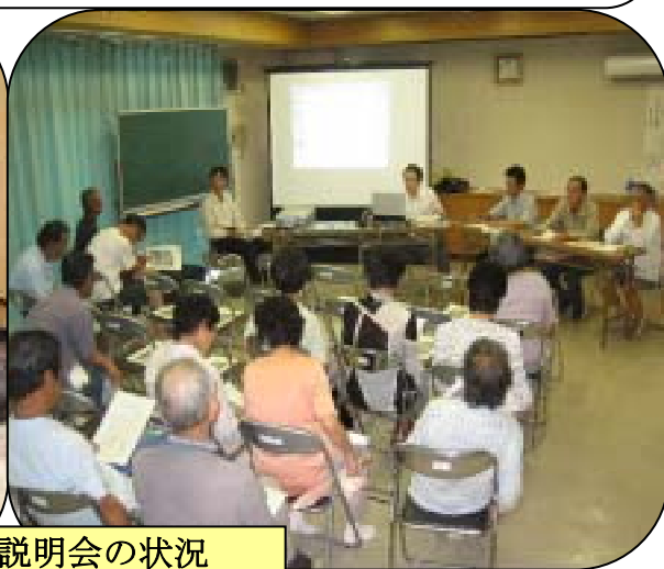
8月19日の説明会の状況

災害は突然襲ってきます。阪神・淡路大震災では、救出された人たちの約6割が、家族や近所の方により救出されたという報告があります。自分たちの地域は自分たちで守っていこうではありませんか!!