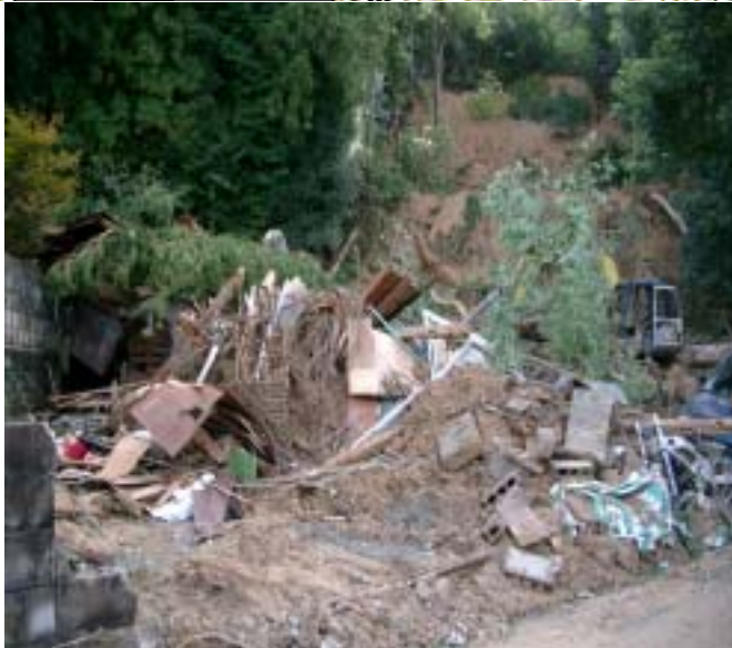
吉田町上迫地区における土砂災害発生現場（18年9月）