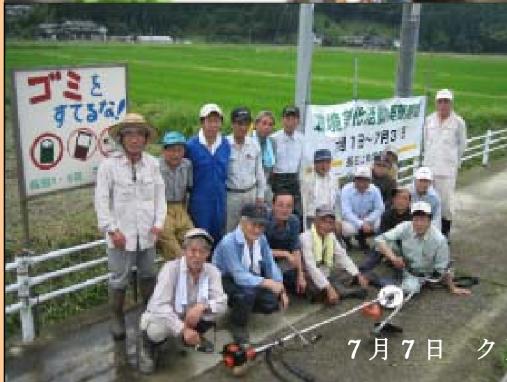
7月7日 クリーン作戦