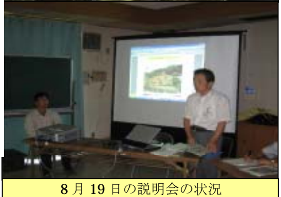
8月19日の説明会の状況