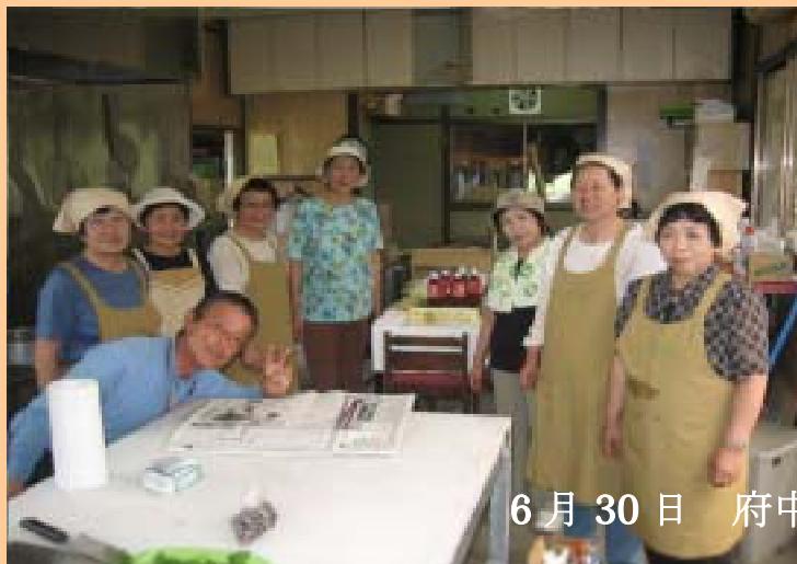
6月30日 府中町との交流会