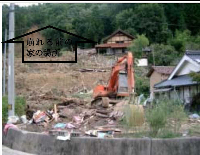
吉田町小山地区における土砂災害発生現場（18年9月）

去る8月19日に、地域内を3会場に分かれ、各行政区単位で「自主防災組織」の設立について説明会が開かれ、市の防災・安全推進担当の職員から、危険地域や設立の趣旨についての説明がありました。