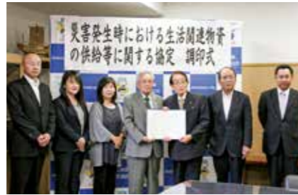
5月8日(水)／生活協同組合ひろしま

市では、これまで国、地方公共団体、民間企業等と協定等を結んできました。引き続き、災害時でも市民の安全・安心が確保できるよう、各種団体と連携を図っていきます。