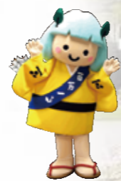
公式マスコットキャラクター「たかたん」

「たかたん」は安芸高田市の里山を守る童子(鬼の子ども)です。頭は緑っぱいの山、たすきは江の川・太田川の源流を表しています。背中には毛利元就でおなじみの三本の矢をつけ、安芸高田市を全身で表現しているマスコットキャラクターです。